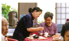
朝食サービスの様子