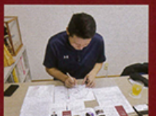
ユニフォームに求めるものを 円グラフにしてみました。