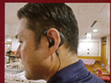
インカムイヤホン