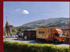
施設外観 手前のトラックが移動式訪問美容室