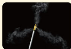
▲デリバレーデバイスから水蒸気が噴霧されています