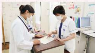
▲看護師と綿密な打合せ

Q 先生が小児科を目指されたきっかけを教えてください。 医学部に入学したときには心臓外科に興味があり、「子どもが大好き」というわけではありませんが、5年生になり臨床実習で小児科をまわったとき、小児がんで長期入院している女の子を担当することになり