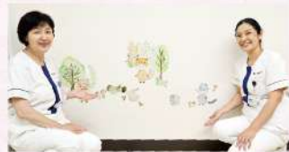
▲子どもさん目線にも可愛いステッカー

Q 先生が専門とする領域について教えてください。 専門領域は小児循環器です。胎児心エコー検査、新生児から成人期までの先天性心疾患、カテーテル治療、周術期管理に関わってきました。当院では外来だけになります。学校心臓健診の精検、心雑音、不整脈、胸痛などの診察に生かしていければと考えています。起立性調節障害についても心疾患の鑑別を行つたうえで、心身症の側面を含めて積極的に取り組んでいます。