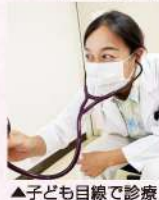
▲子ども目線で診療

ました。(今思えば、見ず知らずの学生に愛想をふりまいてくれるわけでもないのですが)訪室しても無言で笑顔を見せない子でした。難しい病気であることは先生の私にもわかりましたので、本人にも親御さんにもどんな表情で接してよいのかと困惑しました。そんな中、小児科病棟の夏祭りがありました。点滴台を押