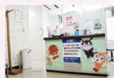
▲子どもたちが安心できる工夫がされた受付カウンター