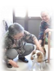
アニマルセラピー